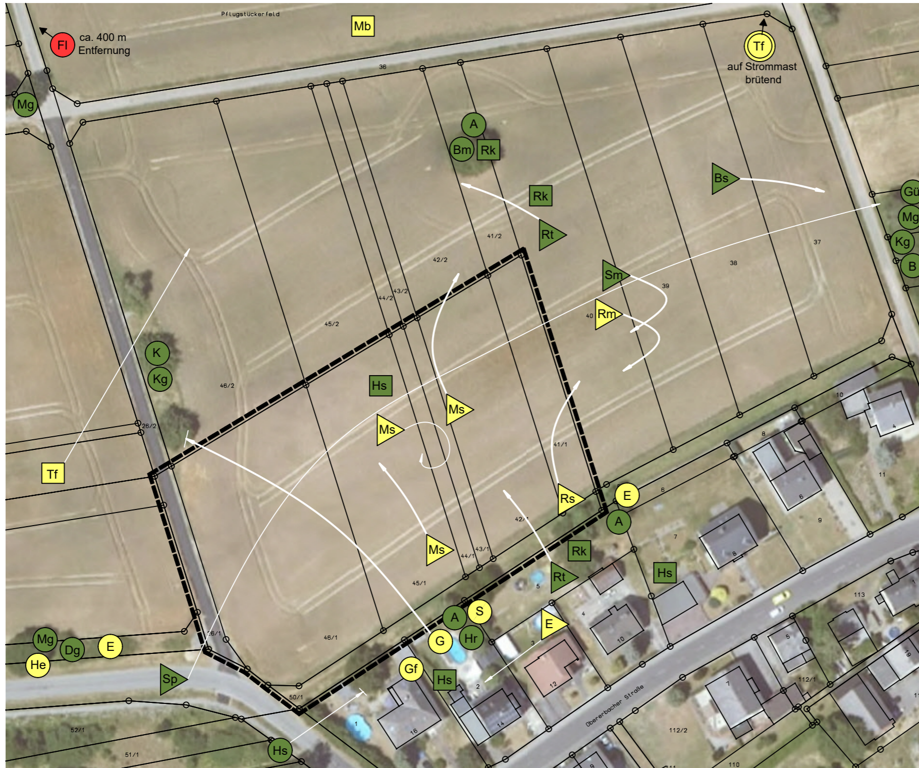
Vogelkartierung im Geltungsbereich 2023/ 2024

PLANUNGSBÜRO SABINE KRAUS Landschaftsarchitektin AKH Odenwaldstr. 4, 65549 Limburg, Tel.: 06431/ 280 980, E-mail: planungsbueroakraus@stadtundfreiraum.de